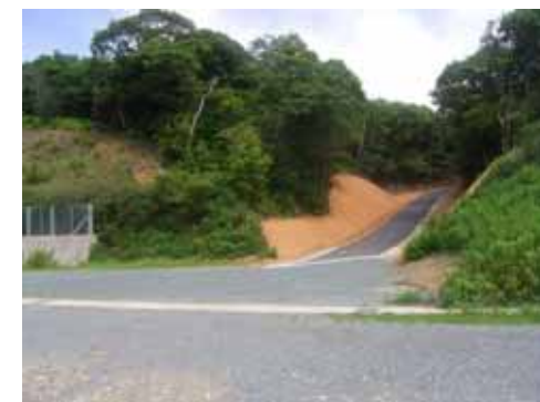
取付道路(国道362号BP取付部)