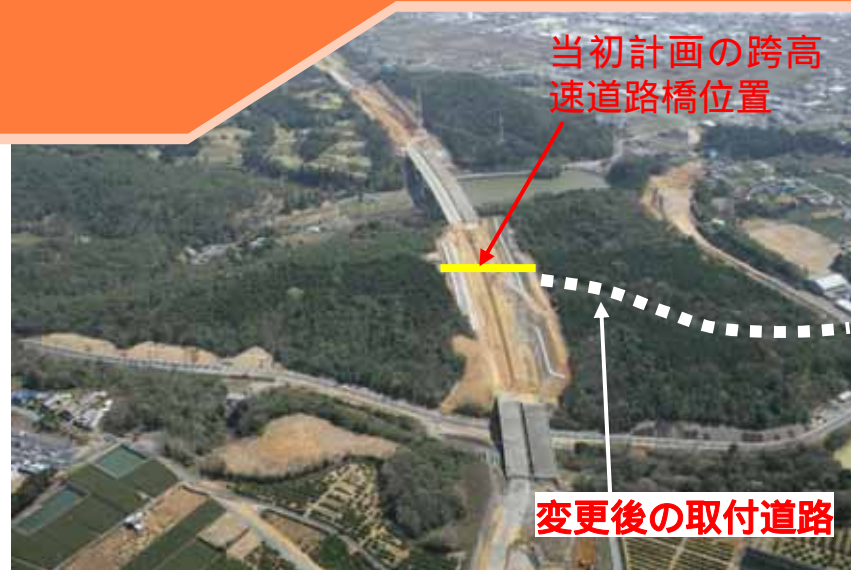
取付道路の見直し(平成19年3月撮影建設中)