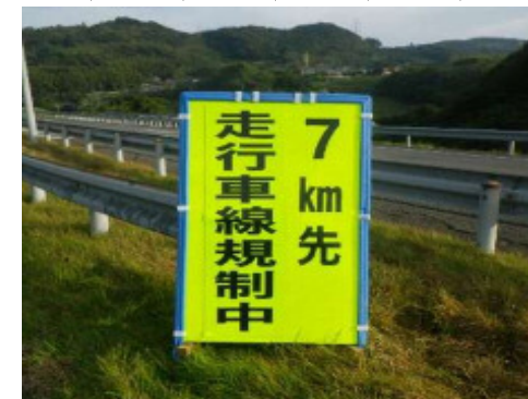
工事予告看板(7km手前)