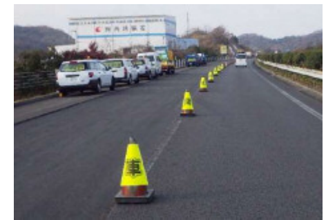
コーンカーバー(車間距離注意)