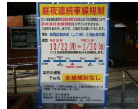
工事予告看板(休憩施設)