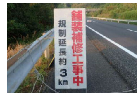
規制延長表示看板