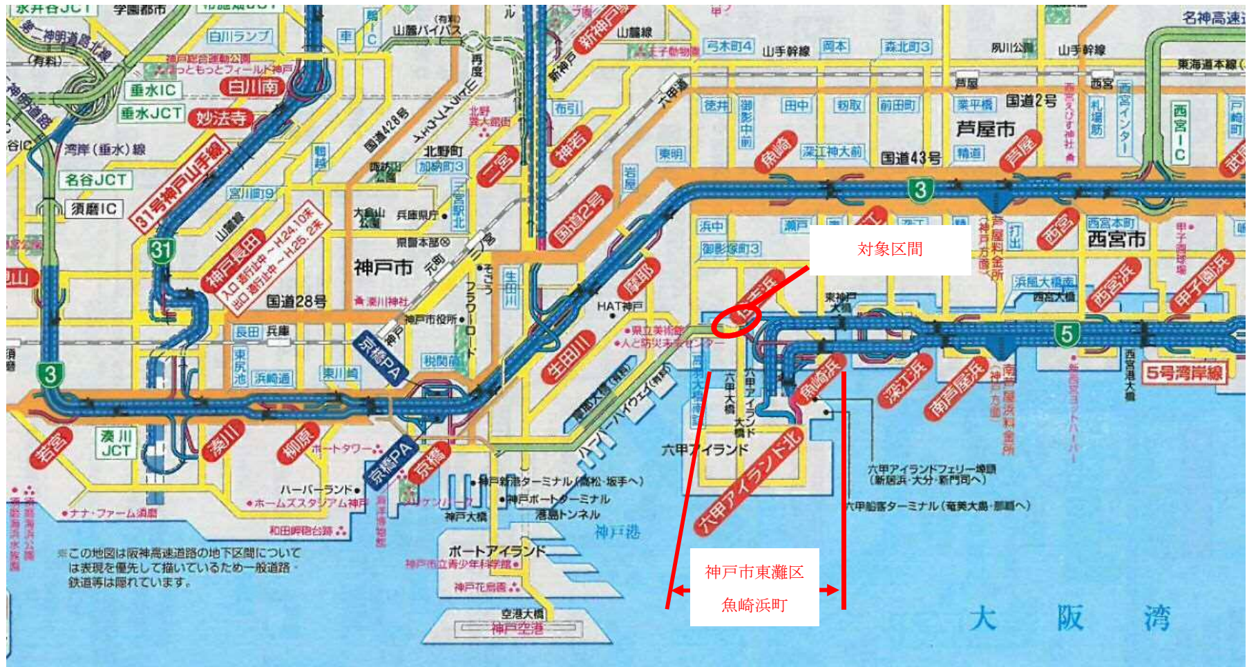
位置図 (神戸市東灘区魚崎浜町区間)