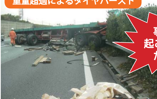
重量超過によるタイヤバースト