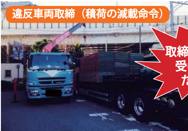
違反車両取締（積荷の減載命令）