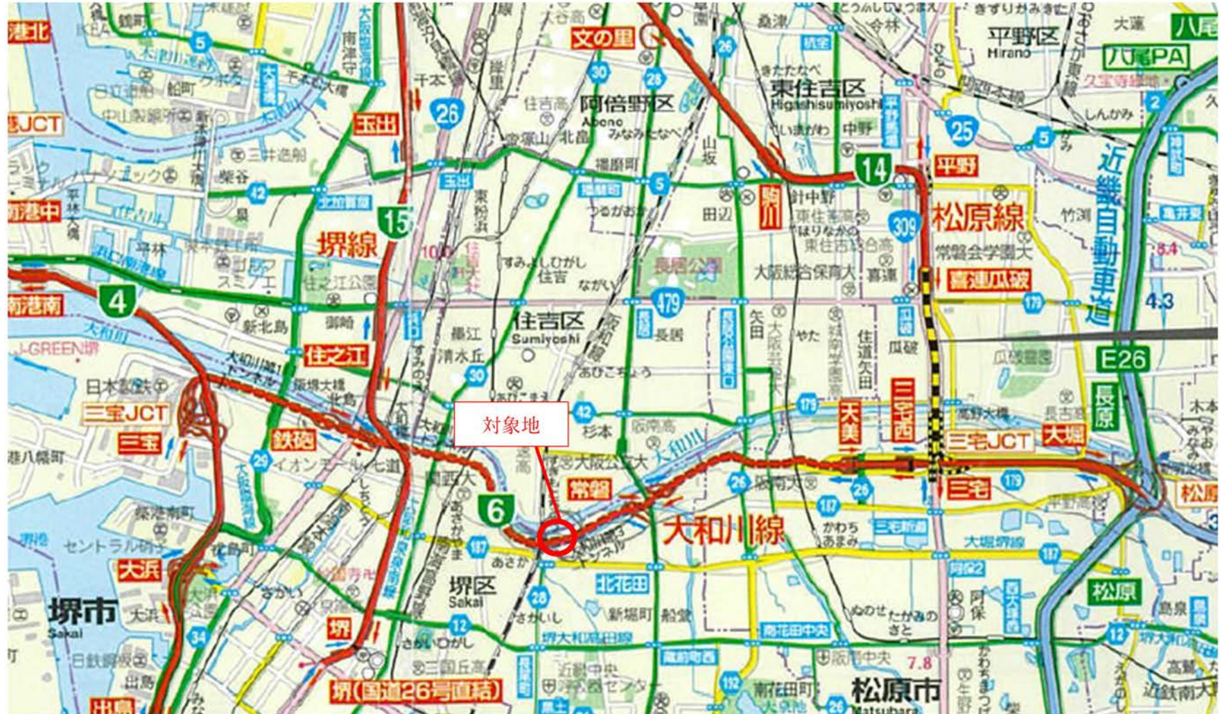
位置図（堺市北区常磐町一丁）