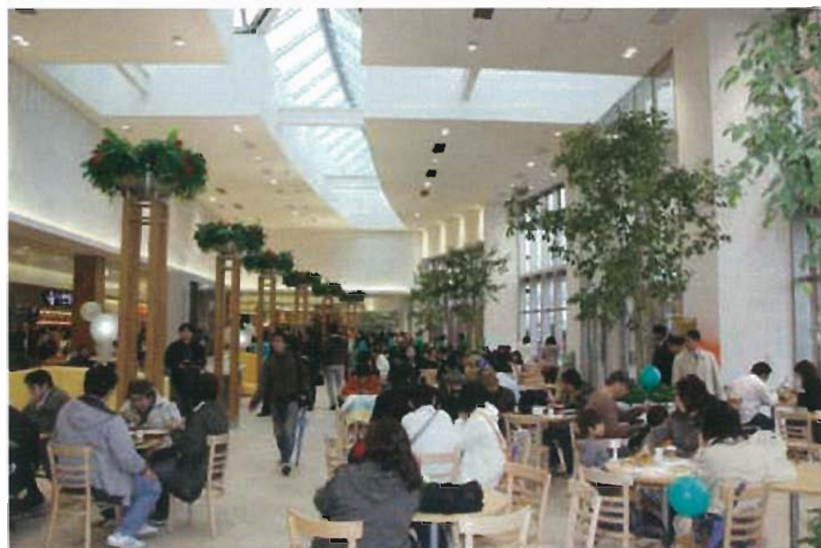
フードコート客席 (開放的な高い天井、明るいトップライト)