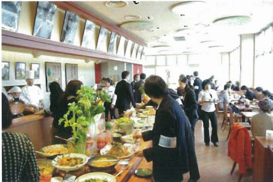
ビュッフェレストラン