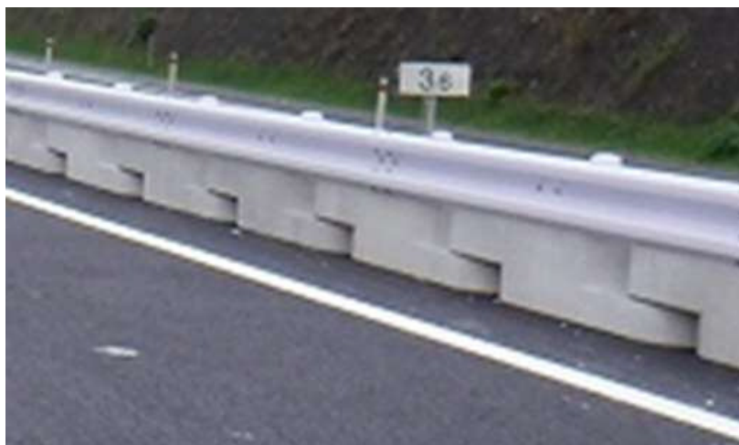
置き式ガードレール設置状況