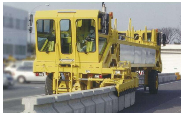
移動式防護柵切替用車両による防護柵移動状況