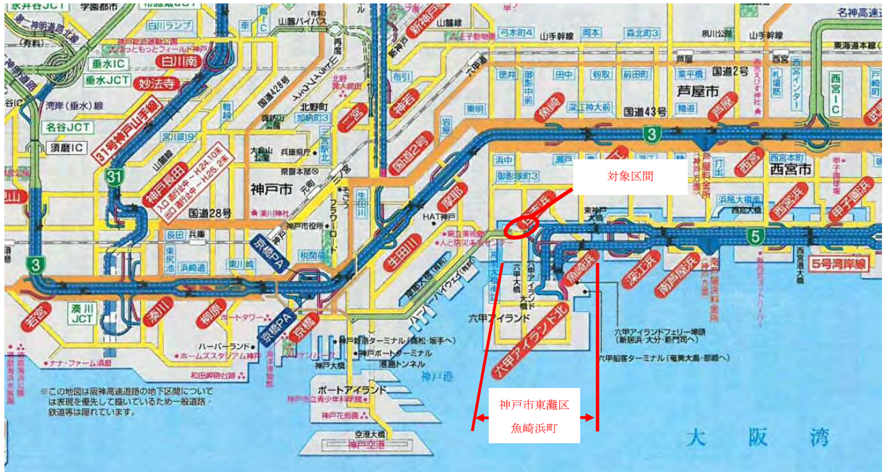
位置図 (神戸市東灘区魚崎浜町区間)