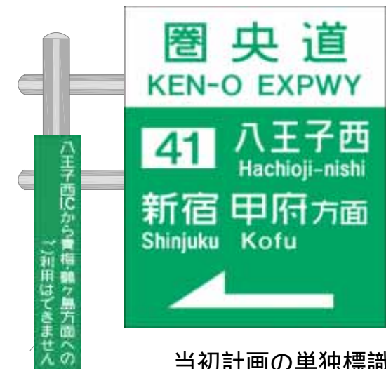
当初計画の単独標識