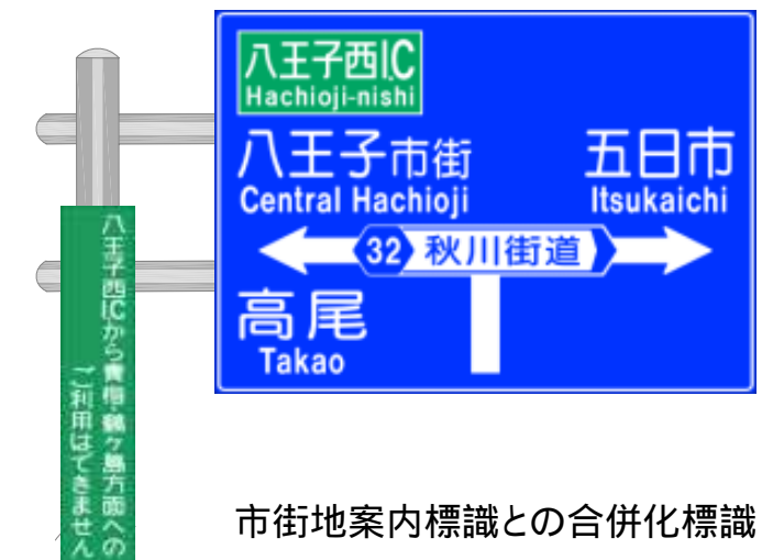
市街地案内標識との合併化標識