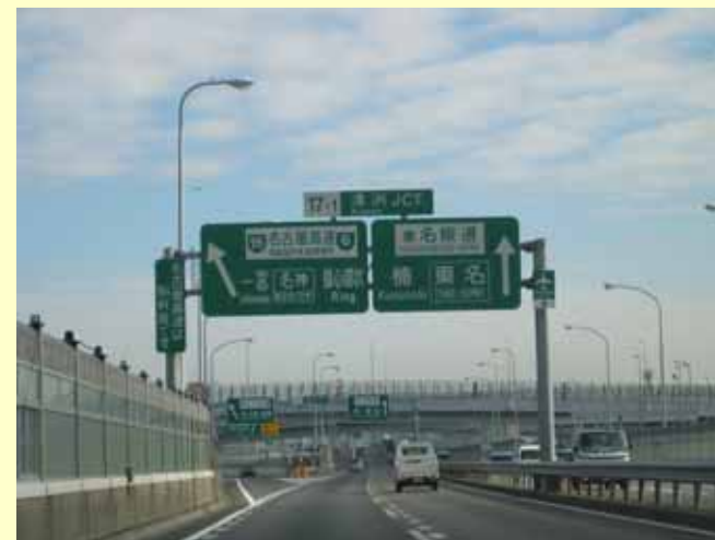
既設門型標識の有効利用状況

➡ 板のみの取替えにとどめたことにより、既設門型標識柱を有効利用でき、車線規制で対応可能となった。