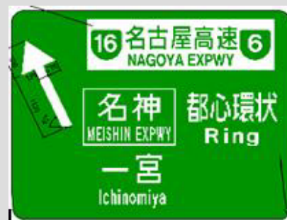
当初計画の3段表示